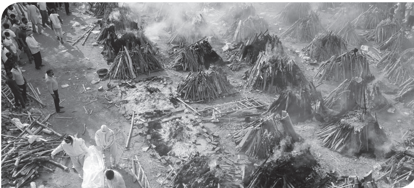
KREMASI MASSAL JENAZAH PASIEN COVID-19 DI INDIA

Suasana kremasi masal mereka yang meninggal dunia akibat penyakit virus korona (COVID-19) di sebuah krematorium di New Delhi, India, Senin (26/4).